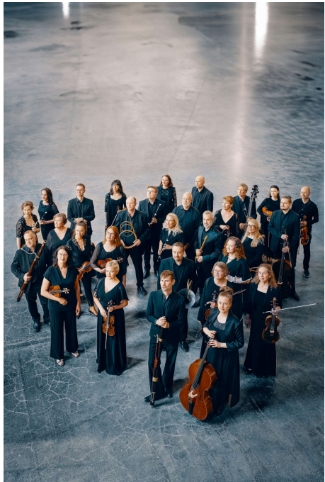
Suomalainen barokkiorkesteri

Vuonna 1989 perustettu Suomalainen barokkiorkesteri (FiBO) on vakiinnuttanut asemansa osaksi suomalaista orkesterikenttää. FiBO on vuosien varrella työskennellyt alan merkittävimpien solistien ja liidereiden kanssa monipuolisen ohjelmiston parissa. Ytimessä on barokkimusiikki, mutta orkesteri tarttuu usein myös muiden aikakausien teoksiin varhaisbarokista aina varhaisromantiikkaan asti. Orkesterilla on myös käynnissä projekti, jossa Jean Sibeliuksen teoksia soiteetaan samankaltaisilla soittimilla, joille säveltäjä musiikkina kirjoitti. FiBO soittaa myös barokkiorkesterille sävellettyä uutta musiikkia ja on kantaesittänyt useita tilaamia teoksia. Ydinkokoonpanon muusikot esiintyvät usein myös kamarimusiikkoina. Laajimmillaan orkesteria kuullaan sinfoniaohjelmiston parissa tai oopperaesityksissä. Suomalaisella barokkiorkesterilla on oma konserttisarja Helsingin Ritarihuoneen juhluvassa ympäristössä, mutta se kiertää lisäksi laajasti ympäri Suomea. FiBO on esiintynyt useaan otteeseen kaikilla Suomen merkittävimmillä festivaaleilla, kuten Helsingin juhla viikoilla, Kuhmon kamarimusiikissa ja Turun musiikkijuhlilla. Kansainvälisistä konserttitarpeista tutuimmiksi ovat tulleet saksalaiset, itävaltalaiset ja pohjoisen alueen salit. Suomalainen barokkiorkesteri on ollut koko historian ajan monella tavalla edelläkävijä. Kuudennen kerroksen orkesteri -nimellä perustetulla orkesterilla oli aluksi tär-